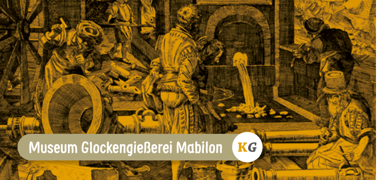
Museum Glockengießerei Mabilon KG