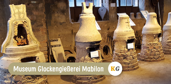
Museum Glockengießerei Mabilon KG