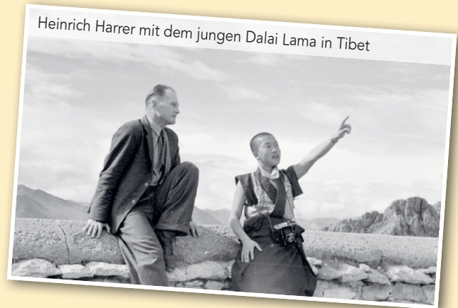
Heinrich Harrer mit dem jungen Dalai Lama in Tibet