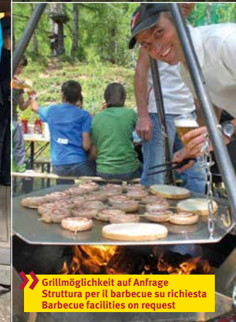
Grillmöglichkeit auf Anfrage Struttura per il barbecue su richiesta Barbecue facilities on request