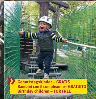
Geburtsstagskinder – GRATIS Bambini con il compleanno – GRATUITO Birthday children – FOR FREE