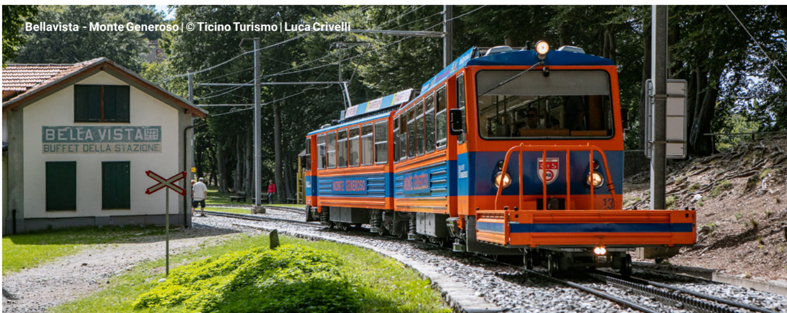
Bellavista - Monte Generoso