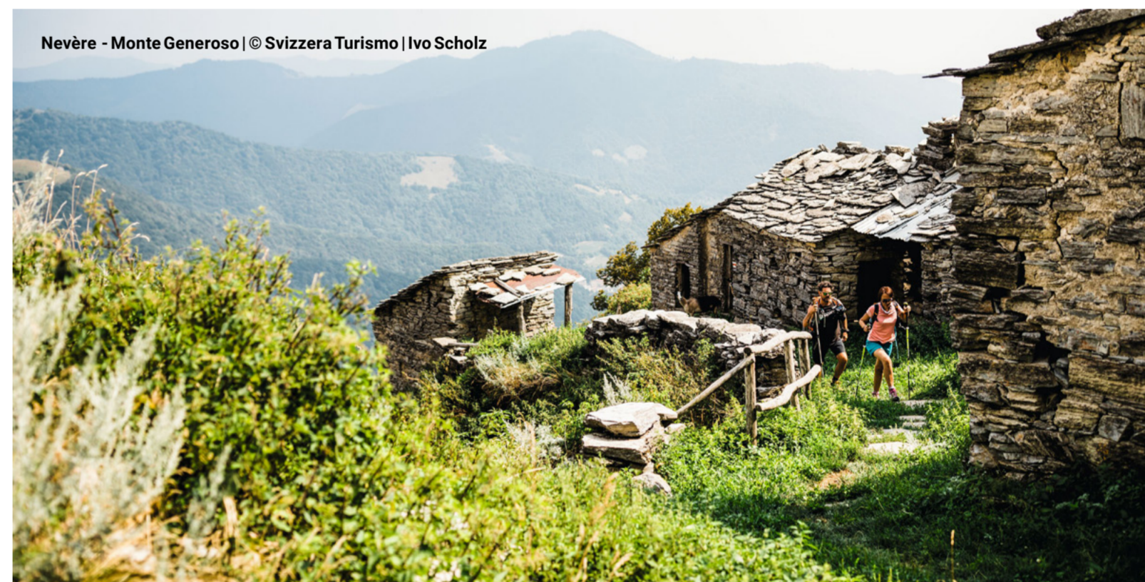
Nevère - Monte Generoso