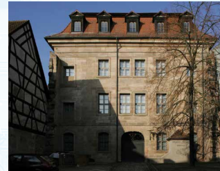
Blick vom Innenhof auf das Museumsgebäude

Eine Stärke des Museums sind anspruchsvolle Sonderschauen. Hierzu zählen Ausstellungen zur lokalen Erinnerungskultur, aber auch zur Kultur- und Zeitgeschichte, zur Medizingeschichte und Kunst. Gerade dieses Spektrum, das durch Kooperationspartner, wie die Universität, mit geprägt wird, findet beim Publikum große Resonanz.