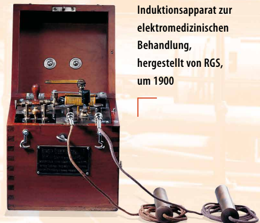
Induktionsapparat zur elektromedizinischen Behandlung, hergestellt von RGS, um 1900