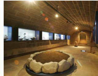
Ausstellungsraum Kult und Bestattung – zugleich Erinnerungsort an die kampflose Stadtübergabe am 16. April 1945

Zu den herausragenden Objekten zählen ein etwa 25 000 Jahre altes Steingerät aus einer Spardorfer Lehmgrube oder einer der gravierten Steinblöcke, die als „Erlanger Zeichensteine“ in die Literatur eingegangen sind. Auch der „Kosbacher Altar“ wird als einzigartige prähistorische Kultstätte gewürdigt.