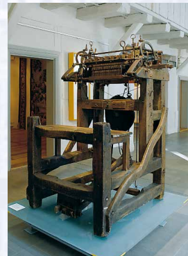
Strumpfwirkerstuhl, Erlangen, 1716 Die Strumpfwirkerei war das Hauptgewerbe der Erlanger Neustadt.