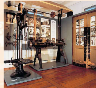
Maschinen aus der Betriebsschlosserei der Firma Zucker, um 1900

Die technischen Errungenschaften und sozialen Probleme der Zeit werden am Beispiel der Elfenbeinkammfabrik Bücking, der Bürstenfabrik Kränzlein, der Lederwaren- und Kartonagenfabrik Zucker, aber auch der „Erba-Spinnerei“ und von „RGS“ anschaulich gemacht. Darüber hinaus geben Sonder-sammlungen, etwa Bleistiftspitzer von Möbius und Messgeräte von Gossen, Einblick in das Warensortiment Erlanger Firmen.