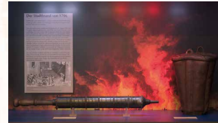
Schauvitrine zum Altstadtbrand am 14.8.1706

Ein wichtiges Zeugnis der Altstadt ist das angrenzende schiefwinklige Gewölbe, das auf einen Vorgängerbau des Altstädter Rathauses zurückgeht. Die hier gezeigten Pläne zu den umliegenden Kellern geben Hinweise auf die unregelmäßige Ausrichtung der Straßen und Gebäude vor dem Brand von 1706. Es wird deutlich, wie sehr der Wiederaufbau im Stil der barocken Neustadt den ursprünglichen Stadtgrundriss verändert hat.