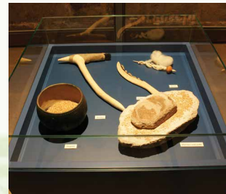
Schauvitrine mit originalen und rekonstruierten steinzeitlichen Arbeitsgeräten (Steinbeil, Erntemesser, Mahlstein und Läufer, Spindel, Tongefäß)