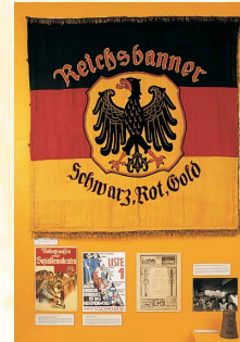
„Reichsbanner“-Fahne aus Erlangen-Bruck, 1924/26 – Zeugnis der Zeitgeschichte

Die Verlagerung der Hauptverwaltung der Siemens-Schuckertwerke AG von Berlin in das unzerstörte Erlangen bedeutete 1945 den ersten Schritt zur wohlhabenden Angestelltenstadt und zur Großstadt (1974).