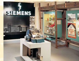
Siemens prägt das moderne Erlangen.