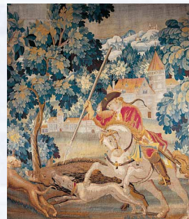
Wandteppich „Wildschweinjagd“ aus der Werkstatt de Chaux, 18. Jh. (Ausschnitt)