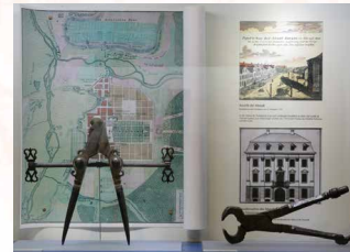
Schauvitrine zum Wieder- aufbau, mit Homann- Stadtplan, 1721, und Zimmermannszirkel, 18. Jh.