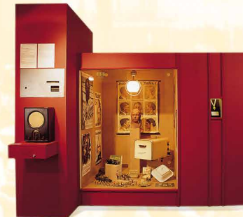
Erlanger Alltag im Nationalsozialismus