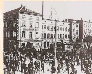
Die elektrotechnische Fabrik Reiniger, Gebbert und Schall, 1914 – Ursprung der Siemens-Medizintechnik