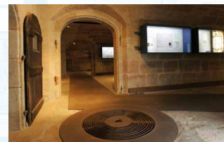
Blick in den Museums-keller mit Brunnen des Vorgängerbaus