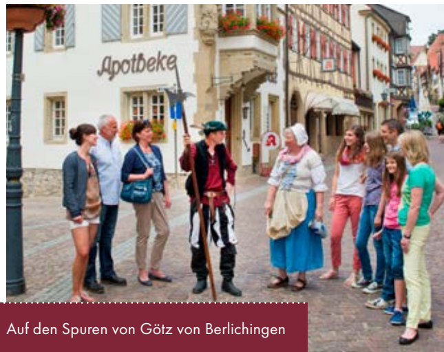
Auf den Spuren von Götz von Berlichingen

Von März bis Oktober jeden Samstag sowie an Feiertagen thematische Führungen. Fragen Sie nach unserem Sonderprospekt Stadtführungen & Mehr.