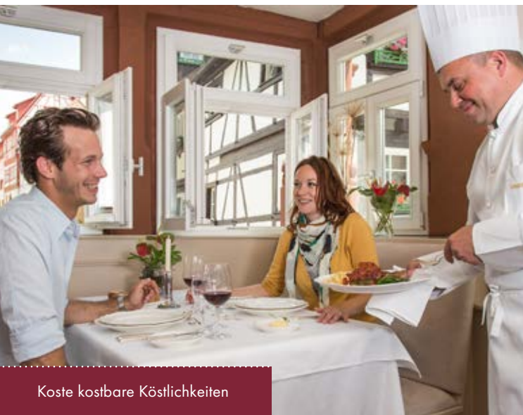
Koste kostbare Köstlichkeiten