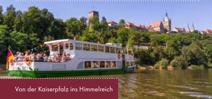
Von der Kaiserpfalz ins Himmelreich