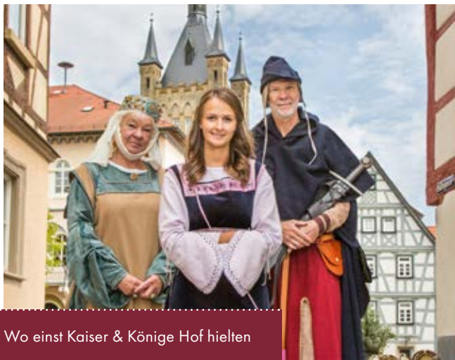
Wo einst Kaiser &amp; Könige Hof hielten